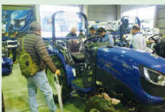
販わう展示場の様子