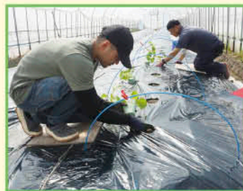
▲経営実証圃での研修の様子

アムスメロン栽培に対する興味を持ってもらうため、「周ちゃん広場」に隣接の経営実証圃で研修を行っています。実証圃での栽培実習を継続的に行うことで、多くの不安を解消しながら興味を深めてもらいたいと考えています。