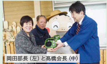
岡田部長（左）と高橋会長（中）