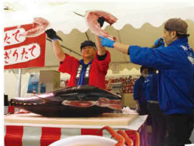
◀大きなマグロが見る間に解体されました!

2月24日、25日の2日間、『柑橘フェア』を開催しました。せとか、紅八朔、宮内伊予柑などの新鮮な柑橘が勢揃い! 産地直送の高知産土佐文旦や、周桑産はだか麦の味噌を使ったカニ汁の販売などが行われ、多くの来店客で賑わいました。両日、大起水産による迫力満点の大きなマグロの解体ショーが行われ、握りたてのお寿司や、目玉、ほほ肉などのプレゼントジャンケン大会は大盛り上がりでした。