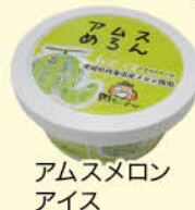
アムスメロン アイス

アムスメロン栽培は収穫量に限界があると同時に、正品としては販売できない下位等級の品物や割れ果などが発生することによる収入の不安定さがリスクとなります。一方、受入品質を下げることはブランドイメージを大きく損ねることに繋がります。そのため、正品として出荷できないものについては、加工品の原料などとして積極的に受け入れ・販売を行うことにより、少しでも生産者に多く還元できるよう、安定したメロン栽培の実現に取り組んでいます。