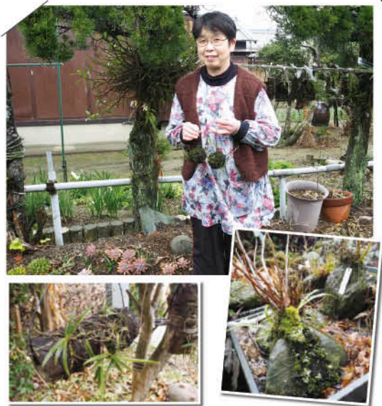
▲風情がある作品がたくさん並んでいます！