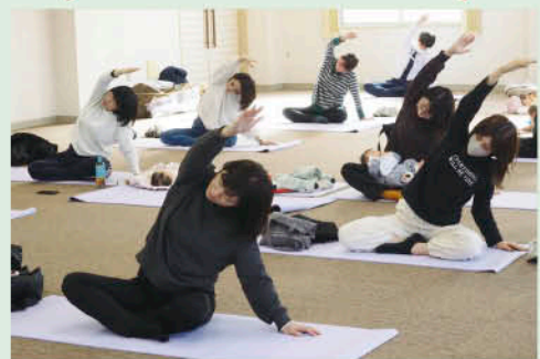
普段しない動きでリフレッシュ!