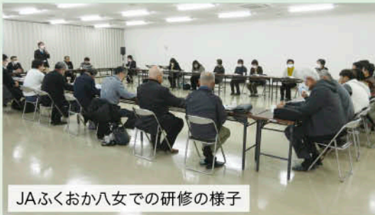
JAふくおか八女での研修の様子

1月30日、31日の2日間、JA周桑農振協と女性部の約20人は、福岡方面への視察