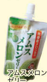
アムスメロン ゼリー

丹精込めて育てた美味しいアムスメロンをたくさんの方に食べていただけるよう、メロン部会一同、課題解決に向けて精一杯取り組んで参ります!