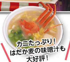
カニたっぷり! はだか麦の味噌汁も 大好評!