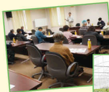
◀令和6年産 メロン講習会

近年は、異常気象などの影響で栽培環境も安定しない状況が続いています。部会では、指導員による定期的な現地指導や栽培講習会を通じて栽培技術の向上と部会員との情報共有を密にすることにより、大玉・高糖度のメロン栽培に取り組んでいます。また、メインとなる春作に加え、秋作（8月定植・11月収穫）の栽培技術確立と面積拡大を行い、年間の販売量拡大と安定した収入確保にも取り組んでいます。