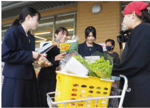
▲特殊詐欺被害防止を呼び掛ける様子

4月26日、行楽期を前に、西条西警察署や西条地区防犯協会らと連携し、「周ちゃん広場」駐車場で来店客に特殊詐欺被害防止を呼びかけました。丹原地区の特産品「クルマ」の語呂に合わせて、 く い止めよう る すでん設定 み んなに相談、名付けて「クルマ大作戦」として、地元の高校生防犯ボランティアC.A.P.のメンバー16人とJA職員らが「国際電話を利用した特殊詐欺被害の防止のために、固定電話は留守番電話にしてください」などと声をかけながら、被害防止に関するチラシや周桑産クルマを手渡しました。参加した高校生は「地域みんなで声をかけ合って、詐欺被害をなくしていきたい」と話しました。