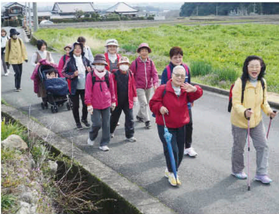
▲歩いて話して笑って、健康が一番!

3月28日、女性部は春のウォーキング大会を行いました。仲間づくりと健康維持を目的に毎年春と秋に2回行っており、今春は庄内支所から本谷公園までの往復約6kmのコースに挑戦しました。うらかな春の陽気の中、田畑に広がる風景を満喫しながら、他支部との交流を深めました。近日の気温の低下で、桜の開花は見ることはできませんでしたが、女性部員の笑顔には満開の花が咲き誇りました。