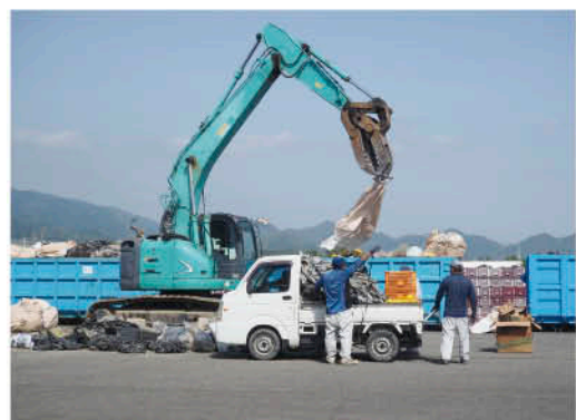
▲廃棄ビニールを回収する様子

4月15、16日の2日間、営農管理研修センターで廃棄ビニールの回収を行いました。農業で排出されるプラスチック類の廃棄物は一般のごみとして廃棄できないため、JAでは毎年4月に一括回収を行い、管内農家の処分負担軽減に取り組んでいます。農家からは「処分するのに困るので、回収してもらえるととても助かる」と多くの申込者が訪れました。今年は89トンの廃棄ビニールが持ち込まれ、JA担当者は「農家から『続けてほしい』との声が多いので、今後も続けていきたい」と話しました。