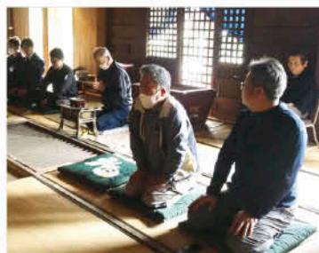
▲冥福を祈る参加者

その後、営農管理研修センターで総会が行われ、令和5年度の活動報告や令和6年度の活動計画について協議。今年度は、防疫・衛生管理の徹底、コスト低減による安定経営、勉強会を積極的に開催し、基本的な飼育技術を確認することなどを協議しました。