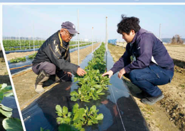
▲JAの営農指導員とこまめに情報交換します。