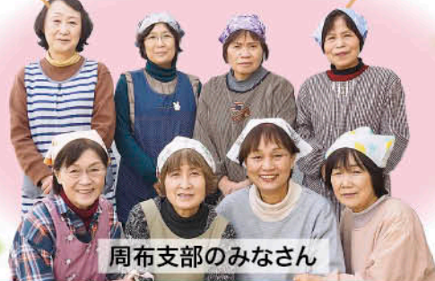
周布支部のみなさん