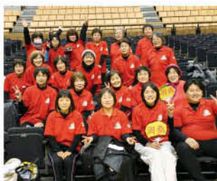
▲参加したメンバー

1月8日、愛媛県内のJA女性部員同士の絆を深め、心と身体の健康づくりのため「JAグループ愛媛健康寿命百歳プロジェクト」と連携し、「JAえひめ女性協 第5回運動会」が松山市で開催されました。JA周桑からは、女性部健康福祉部会員、女性部支部長ら約20人が参加し、じゃんけんゲームやお買物競走、仮装行列など10種目の競技に挑戦。寒い冬を吹き飛ばす熱い戦いが繰り広げられ、楽しく他JA女性部員との交流を深めました。