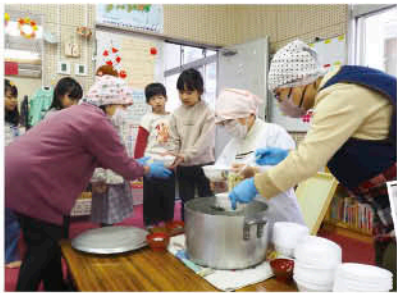
▲「苦手な野菜も全部食べられた!」と大好評

1月7日、壬生川支部は壬生川小学校で「子ども食堂」を開きました。周桑の美味しいお米をたくさん食べてもらおうと、冬休み学童保育に通う児童と教職員に「ひめの凩」のおにぎりや、七草の日にちなんで、七草の入った野菜たっぷりの煮込みうどんをふるまいました。子どもたちは「七草とうどんもよく合って、とても美味しい!」と大喜びでした。