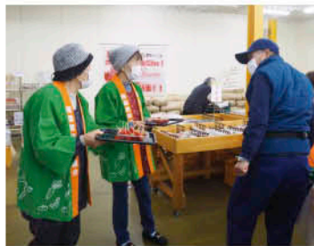
▲「周ちゃん広場」にて

JA担当者は「これからどんどん収量が増えてくるので、県内外でしっかりと『紅ほっぺ』をPRしていきたい」と話しました。