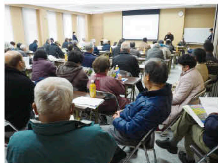
▲吉井地区での説明会の様子

1月15日～2月6日、地区別に令和7年産水稻栽培指針説明会を開催しました。1月22日に行われた吉井地区の説明会では、水稻農家約60人が参加し、JA担当者からの水稻栽培における管理のポイントや追肥の必要性、病害虫や高温障害対策などの説明に熱心に耳を傾けました。参加した生産者は「説明会で学んだことを活かして、今年も美味しいお米を作りたい」と意気込みを話しました。JA周桑では、今後も栽培指導を基にした資材提案など、品質及び反収の向上に向けて取り組んでまいります。