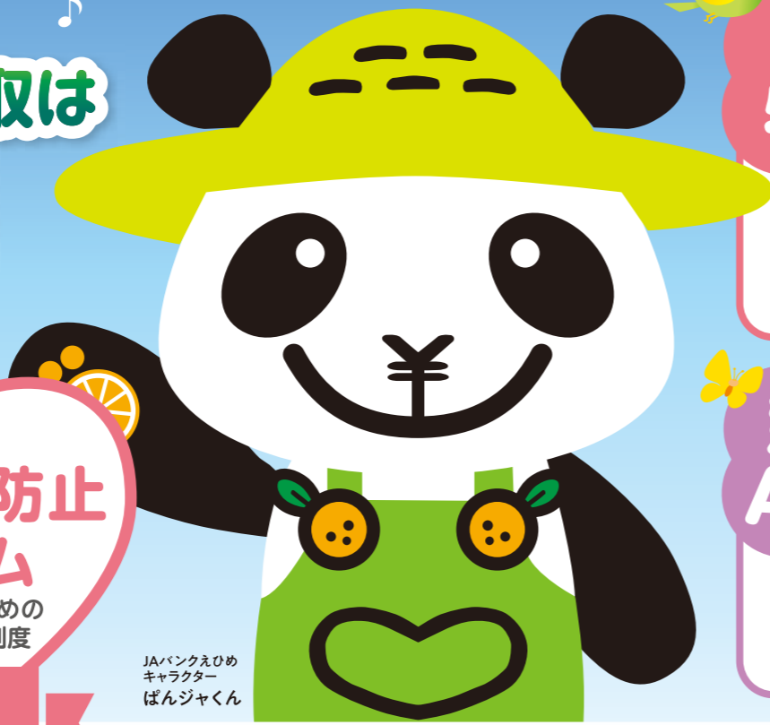
JAバンクえひめ キャラクター ばんじゃくん