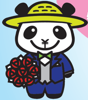
JAバンクえひめキャラクター ばんじゃくん